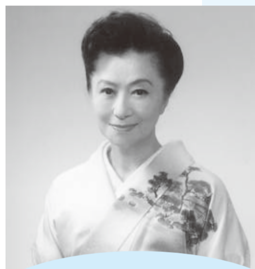
■講師プロフィール 小山明子(女優) 映画・テレビ・舞台で活躍 脳出血で倒れた夫・大島渚の介護体験をつづった本の出版や介護を中心とした内容の講演は、各地で好評を得ている。

2月25日(土) 13時30分～15時、市役所3階315会議室。男女共同参画社会の実現に向けて、あやせ男女共同参画プラン推進協議会・かながわ女性センターと共催で、男女共同参画社会について理解するための講座を開催します。 テーマ 「二人三脚で乗り越えた介護の日々〜今日も二人で〜」の講演。講師は小山明子さん(手話通訳あり)。 介護を通して学んだこと、見えてきたこと、夫と共に過ごす生活の中での体験談です。定員100人(申込順)。 ① 2月24日17時までに市民協働課 ☎70・5640、② ☎70・5701、✉su1140@city.ayase.kanagawa.jpから直接。(2歳未満就学児の保育あり・15日までに予約)。