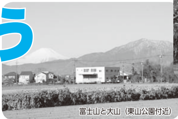
富士山と大山（東山公園付近）