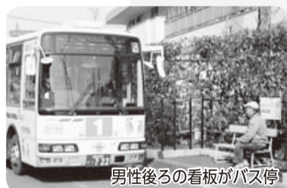
男性後ろの看板がバス停

【壁かけ型のバス停】 民家のフェンスや石垣などを利用したバス停を、道路が狭い場所などに設置しました。