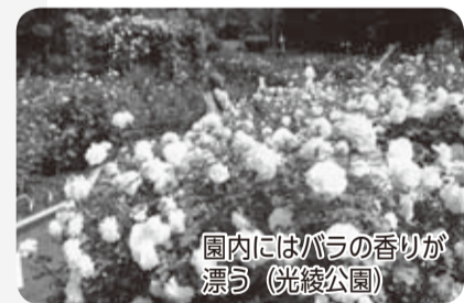
園内にはバラの香りが漂う（光綾公園）

【公園めぐり】 日差しが温かくなるこれからの季節、心の温まる公園めぐりはどうですか。あなただけのお気に入りの場所がきっと見つかります。行きは徒歩で散策し、帰りに買い物などをしてバスで帰宅するのも楽しいです。健康管理と買い物利用のいいとこ取りです。