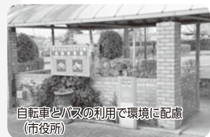
自転車とバスの利用で環境に配慮（市役所）

【自転車やバイク用駐輪場があります】 民間路線バスやコミバスを利用する方のために、市役所、大法寺、上落合、上土棚に駐輪場を用意しています。バイクやアシスト付自転車も停められます。あなたも環境に優しい生活してみませんか。