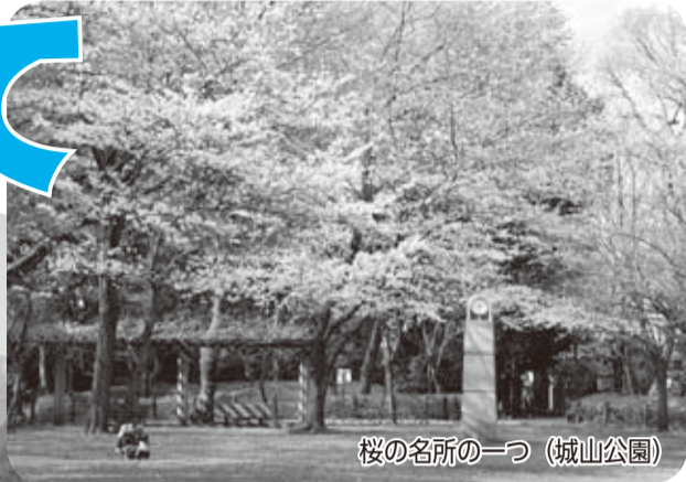
桜の名所の一つ（城山公園）

【眺望点・見どころめぐり】 東山公園からの富士山・大山・丹沢や神崎遺跡付近からの新幹線の全景、城山公園の桜など、市内には多くの眺望点があります。百聞は一見にしかず、写真では表現しきれないじっくりするような眺めを見に、立ち寄ってみてください。