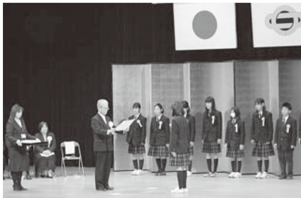
▲ 栄誉をたたえました