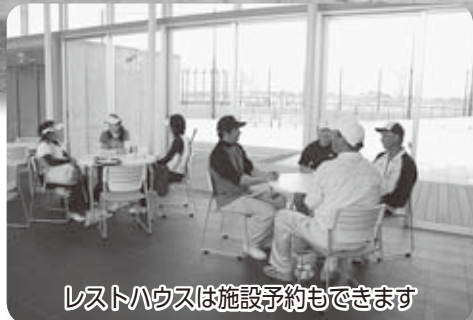
レストハウスは施設予約もできます