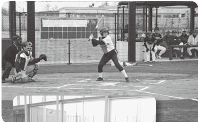
◀本塁両翼長69mのソフトボール場