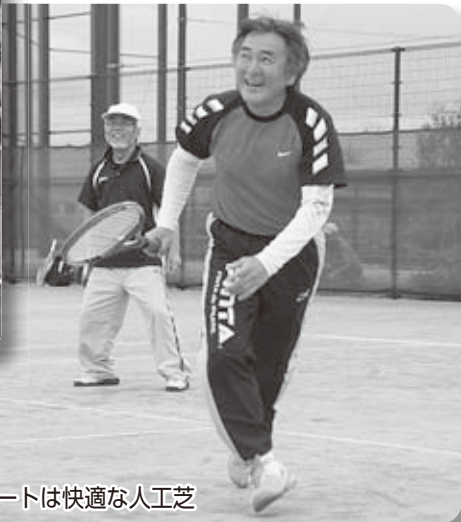
テニスコートは快適な人工芝