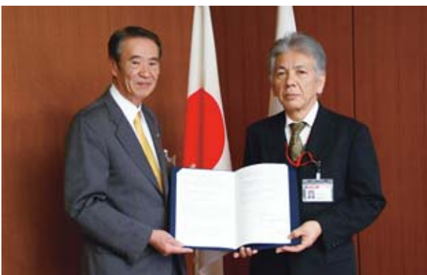
▲日本郵便株式会社綾瀬郵便局との協定締結