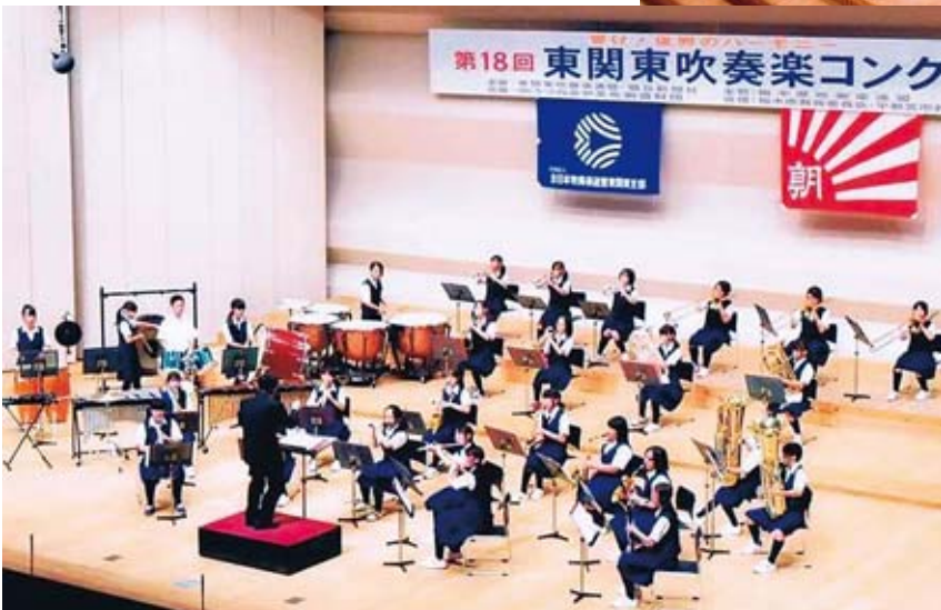
▲綾瀬中学校吹奏楽部

に加え、24年度県吹奏楽コンクール金賞、東関東吹奏楽コンクール銀賞の綾瀬中学校吹奏楽部との合同演奏を披露します。演奏の指揮を体験できるほか、来場者の皆さんと一緒に歌う曲目もあります。フルオーケストラの演奏が鑑賞できる貴重な機会です。