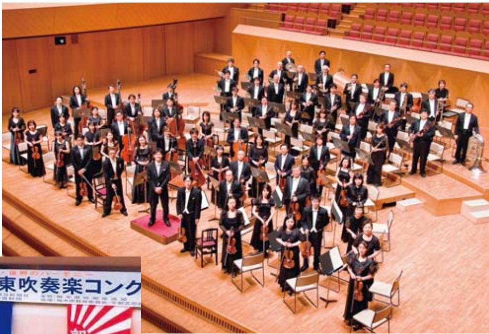
▲神奈川フィルハーモニー管弦楽団

3月27日(水)14時〜16時(開場13時30分)、文化会館でアヤセ・プロムナード・コンサートを開催します。綾瀬・海老名・座間市の文化的交流と、芸術鑑賞の機会の拡大、県央地域の文化振興を図るため実施している事業です。昨年9月に海老名市、今月26日に座間市で開催し、本市で開催するコンサートが3回目となります。