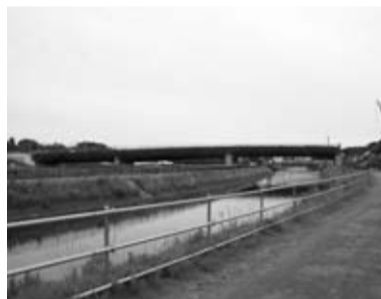
目久尻川護岸からの眺め

変更された方など 保険料の未納がない方は、申し出により支払い方法を、特別徴収から口座振替に変更できます。