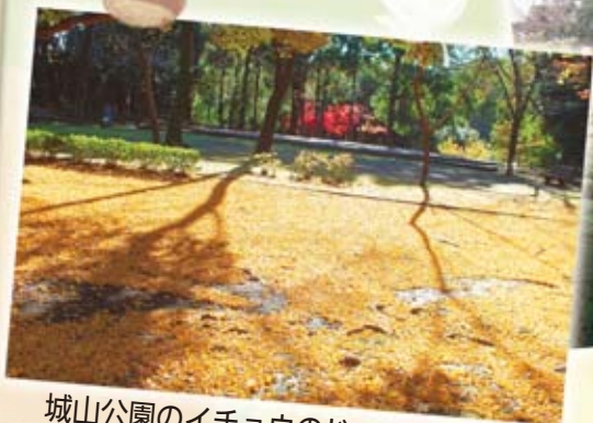
城山公園のイチョウのじゅうたん

市内の多彩な見どころ(お店、公園、社寺など)を地図とともに紹介しています。商工振興課で配布しています(在庫がなくなり次第配布終了)。