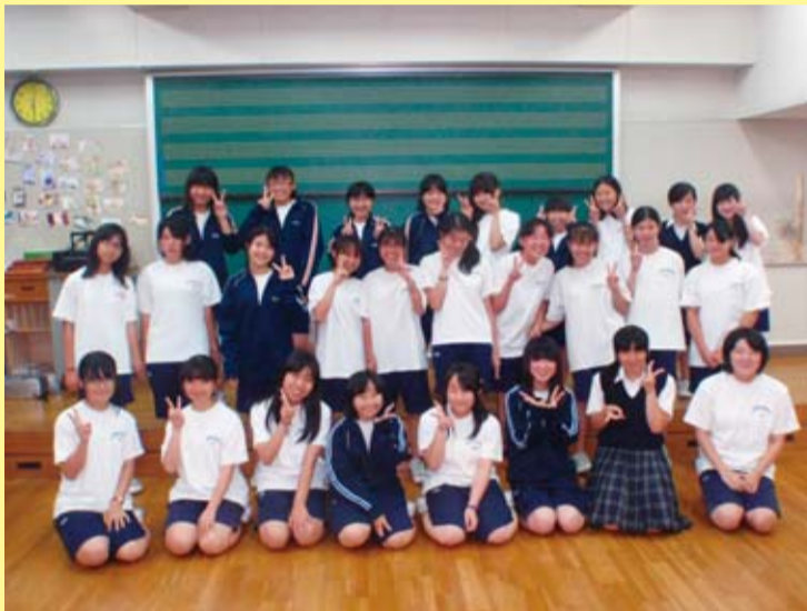
城山中学校吹奏楽部