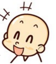
省エネ製品買換ナビゲーション「しんきゅうさん」：環境省