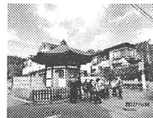
鎌倉上ツ道を歩く