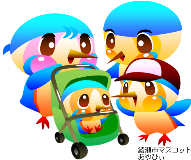
綾瀬市マスコットキャラクター あやびい

「あやせのこそだてしえん」は、児童青少年支援課・保育課・こども家庭センターが実施している、児童手当や児童扶養手当、保育所等の子育て支援について記載しています。