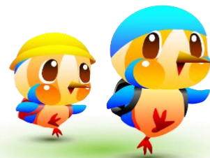
綾瀬市のマスコットキャラクター あやびい