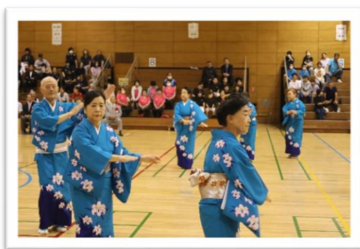
レクリエーション協会