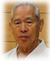
綾瀬市スポーツ協会