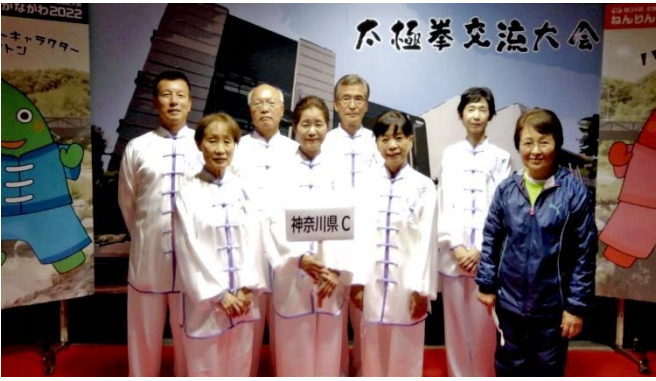
ねんりんピックかながわ2022に出場された皆さん

今年度は最大の催しである市太極拳フェスティバルが実施できました。ねんりんピックかながわ2022において神奈川県代表として出場、全国54団体中10位に入賞しました。また、一月には第29回神奈川県武術太極拳選手権が実施され、各競技種目において好成績を上げ、団体種目のシニアフェスタにおいて優勝し、十月に行われる「第35回ねんりんピック愛媛（えがお）のえひめ2023」に県代表として出場します。