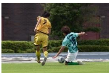
サッカー協会 熱戦の記録