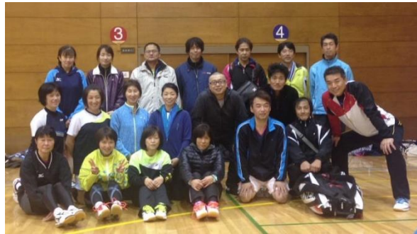
バドミントン協会の皆さん

ミニバスケットボール(小学生)では、なかなかできずにいた他地区との交流大会も、盛んになりつつあります。市総合スポーツ大会では、体力がおちたと、広いコートで汗を流しながら話すお父様方がいました。