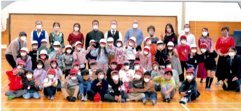
綾北小学校の皆さんと