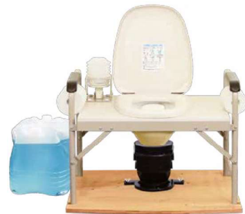
マンホールトイレ便器