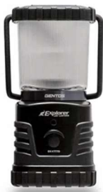
マンホールトイレ用ランタン