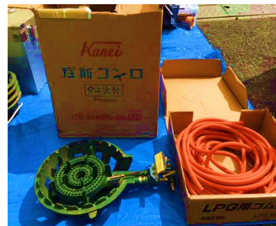
ガスコンロ・ゴム管