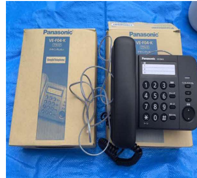
災害時特設公衆電話