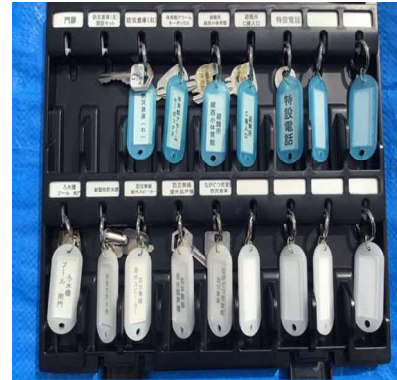
キーボックス (ボックス内)