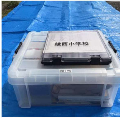
ファーストミッションボックス・キーボックス