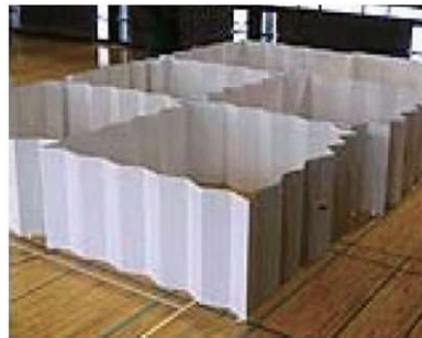
間仕切りユニット