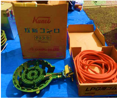
ガスコンロ ・ゴム管