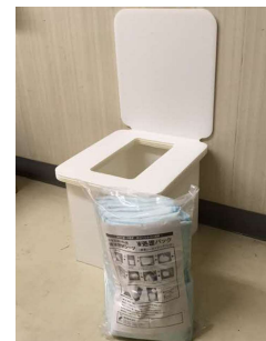
簡易トイレセット (LINDO)