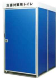
マンホールトイレ建屋