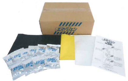
トイレ処理セット (エマージェン)