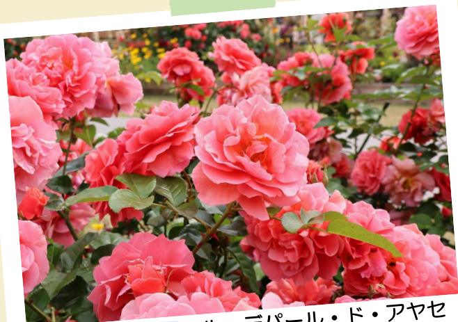
あやせオリジナルバラ