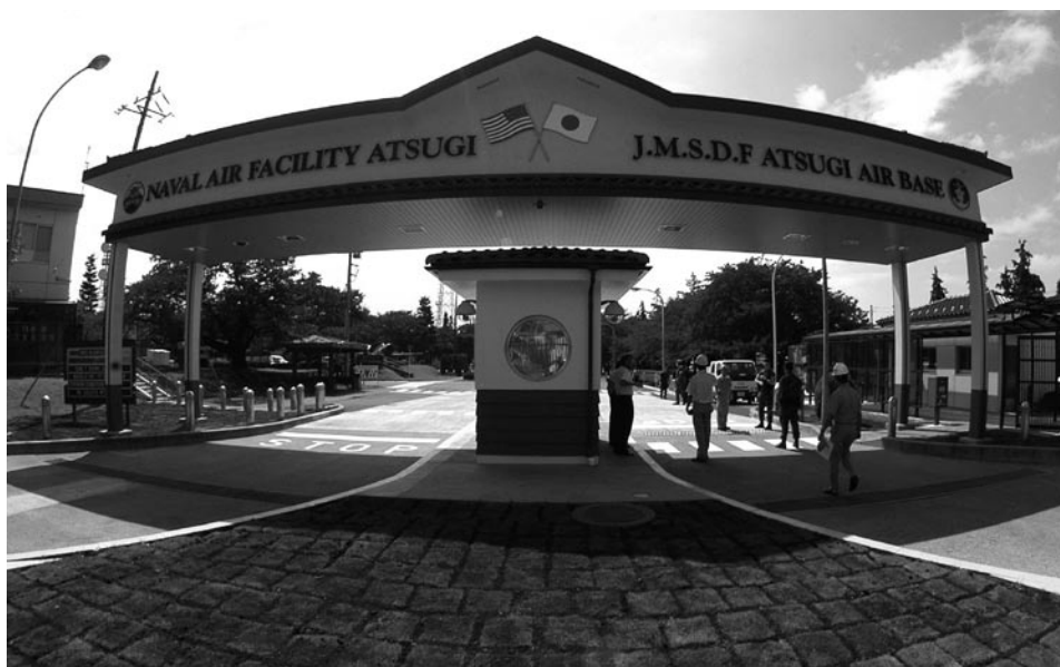
基地正門