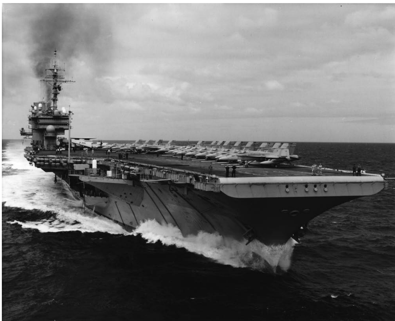
空母キティホーク

平成3年9月11日には、ミッドウェーの後継艦となるインディペンデンスが横須賀に初入港し、平成10年8月11日にはインディペンデンスの後継艦として空母キティホークが横須賀に初入港した。以来、キティホークは平成19年までに33回横須賀に入港している。