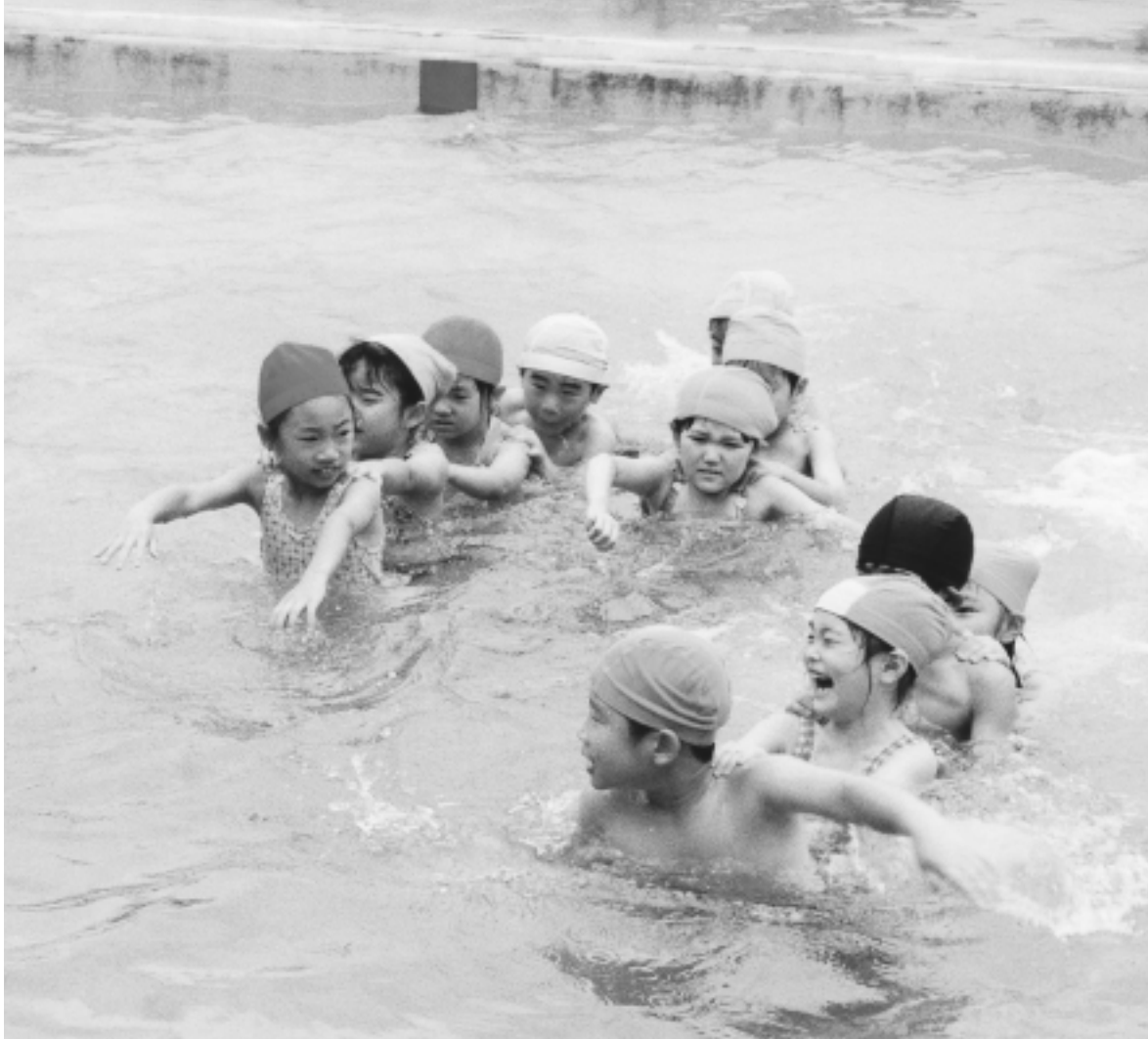
水泳学習で水に親しむことを楽しく学ぶ元気な子ども達<落合小学校プールにて>

●平成15年(2003年)8月 発行 綾瀬市議会 ☎0467 - 77 - 1111 編集 議会報編集委員会