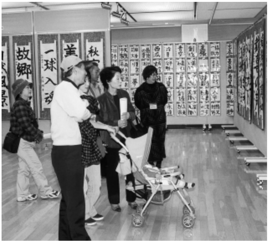
10月22日から26日まで開催された第16回市展絵画・書道の部4歳～小・中学生。子ども達の秀作や力作を熱心に鑑賞していました。市民展示ホールにて。