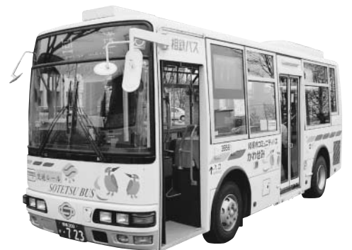
コミュニティバス「かわせみ」