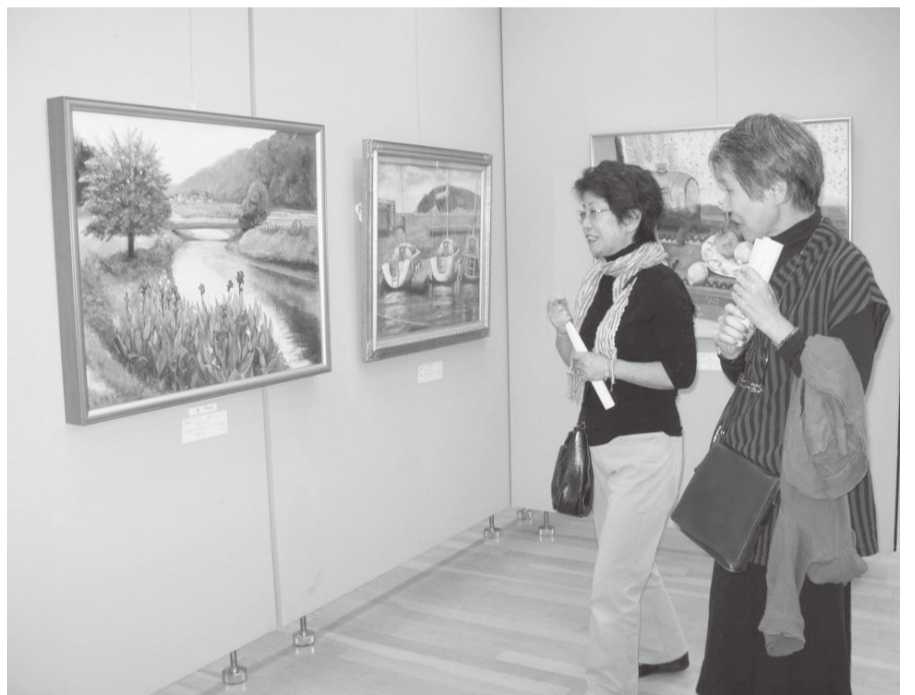
9月27日から10月1日まで、市役所7階市民展示ホールで、第21回市展絵画の部が開催され、91点の力作が展覧されました