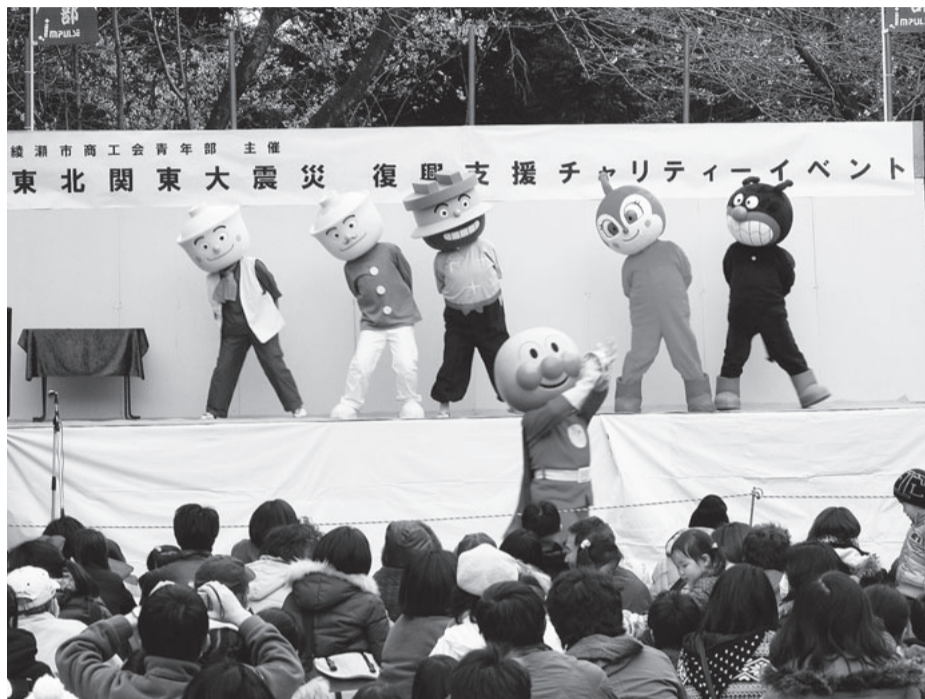
4月3日、例年開催されている城山桜まつりは、東日本大震災の被災地復興のため、チャリティイベントとして開催されました(城山公園にて)

市長は、平成23年度一般会計予算269億5000万円を柱に、6会計予算を提案し、併せて新年度の施政方針演説を行いました。その中で市長は、「地方行政の厳しい状況を踏まえ、事務事業の分析を行い、市民が安全・安心に生