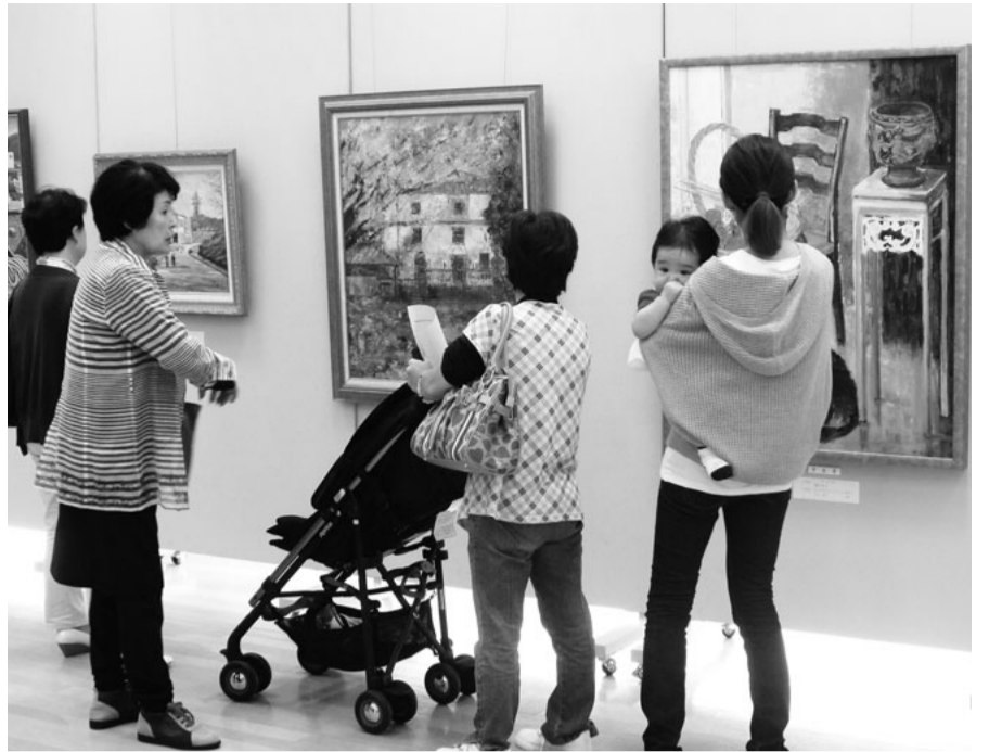
10月5日から9日まで「市展絵画の部（成人）」が開かれ、72点の力作が展示されました（市民展示ホールにて）