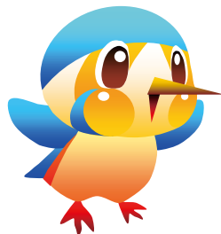
市公式マスコットキャラクター「あやびい」