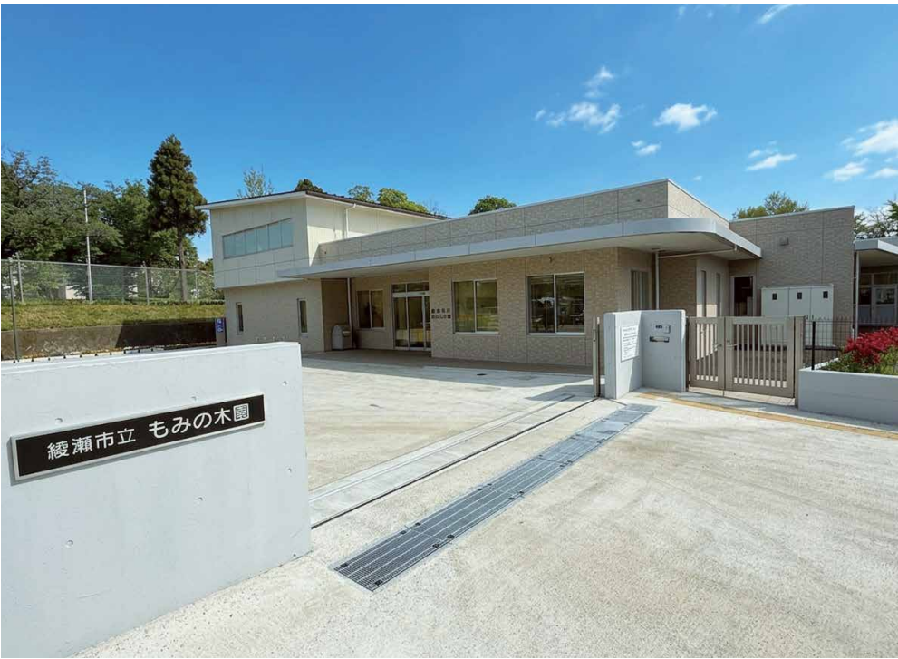
もみの木園の新施設が完成し、4月1日から運用を開始しました