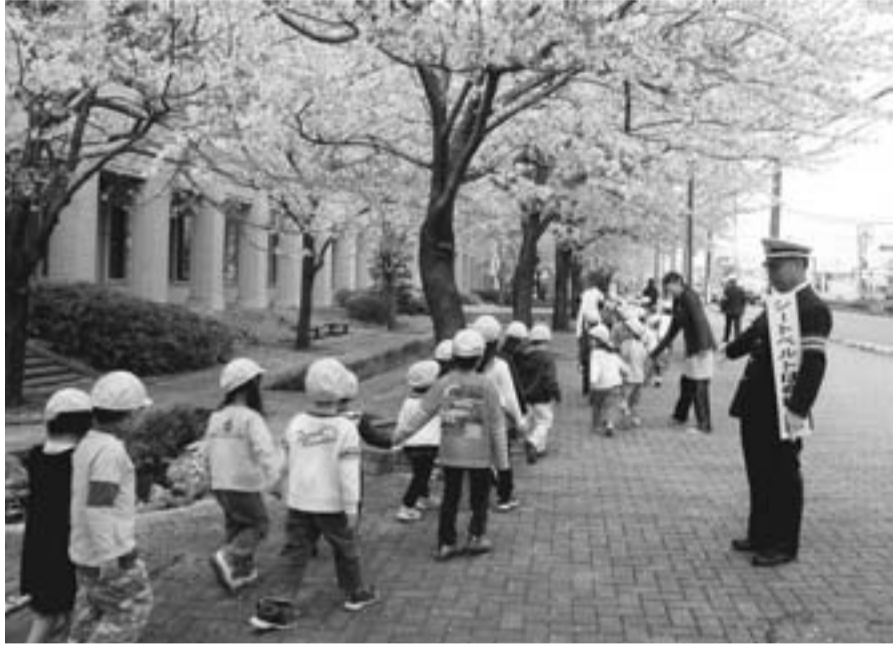
4月9日、「新入学児童・園児を交通事故から守ろう」をスローガンに、春の全国交通安全運動キャンペーンが行われ、道行く人に交通安全を呼びかけました（市役所前交差点付近にて）