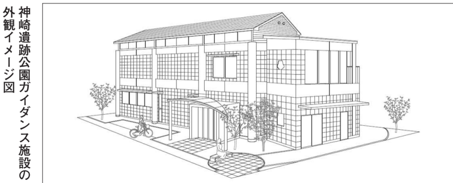
神崎遺跡公園ガイダンス施設の外観イメージ図