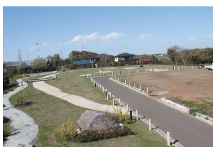
4月1日に神崎遺跡公園が一部開園しました