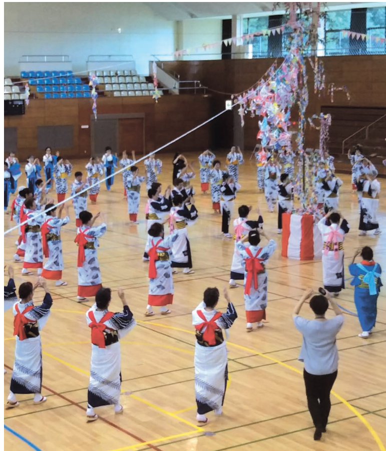
7月26日、「第42回相模さら踊り」が開催されました <IIMURO GLASS綾瀬市民スポーツセンターにて>