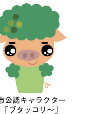
市公認キャラクター「ブタッコリ〜」

A 国に先駆けて5月に臨時特別給付金を支給するとともに、自立支援員の相談を継続している。また、児童・生徒には、毎月、アンケートを行い、状況の把握に努めている。