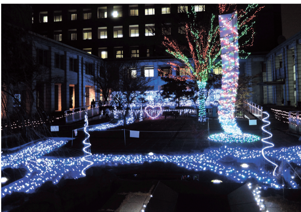
綾瀬イルミネーションが12月7日から1月7日まで開催されました<市役所南側広場にて>

本会議とは、議員全員で構成する会議のことをいい、年四回二月、六月、九月、十二月に開催され、必要に応じて臨時会も開催されます。議会としての権限や能力は本会議に認められるもので、議会の議決、承認、同意などは、この本会議で行わなければ法的な効力はありません。