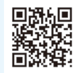
市ホームページ 二次元コード

市議会では、市民の皆さんに議会の様子をお伝えするため、本会議のインターネット配信を行っています。 本会議中の議場の様子をそのまま公開する「生中継」と、会議日程などから見たい場面を探すことのできる「録画映像」を配信しています。録画映像は、本会議終了後4日程度(土・日曜日、休日除く)で視聴できます。詳しくは、議会事務局(電話0467-70-5644)にお問い合わせください。スマートフォンやタブレットでも視聴できます。