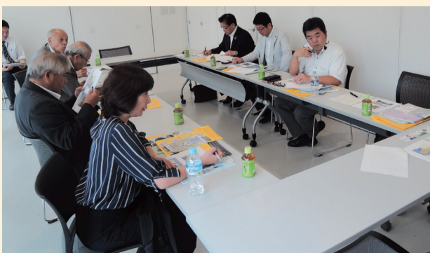
道の駅ソレーネ周南にて