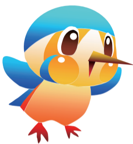
市公式マスコットキャラクター「あやびい」

●藤沢市にある蓼中橋の架け替え時期は。また、隣接する人道橋の取り扱いは。 A 橋の下部工が完成し、今後、上部工を進め、令和2年度中の完成を目指すとしている。また、蓼中橋に歩道ができるため、人道橋は、落橋すると聞いている。