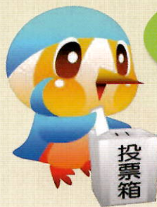
綾瀬市マスコット キャラクター あやびい