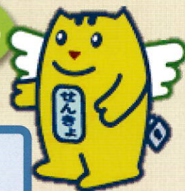
明るい選挙 イメージキャラクター めいすいくん

令和5年4月9日は神奈川県知事・県議会議員、 4月23日は綾瀬市議会議員の選挙の投票日です。 みんなで参加し、投票に行きましょう!