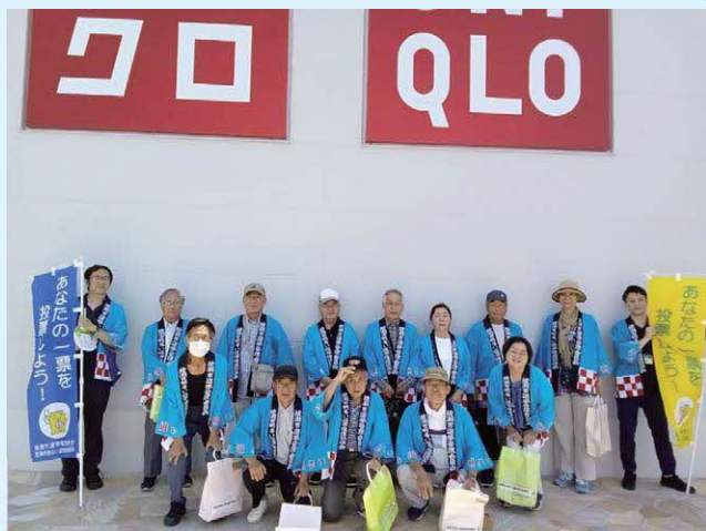
市内にあるヤオコーさん、ユニクロさん店舗にて、翌日の選挙への投票参加を呼びかけました。