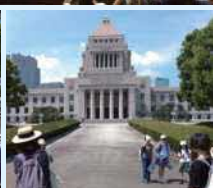
衆議院での見学を行い、政治への関心を持っていただきました。