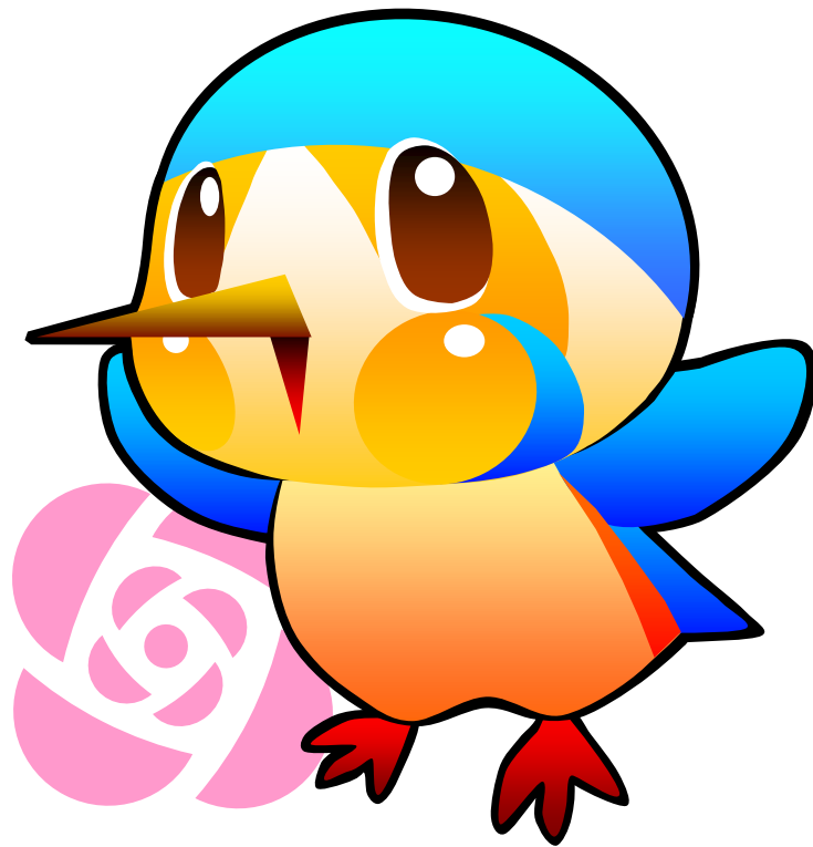
綾瀬市マスコットキャラクター あやびい