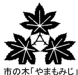
市の木「やまもみじ」