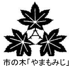
市の木「やまもみじ」