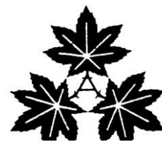
市の木「やまもみじ」