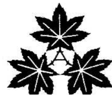
市の木「やまもみじ」