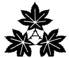
市の木「やまもみじ」