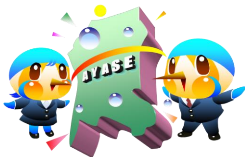
市のマスコットキャラクター「あやびい」

「持続的な成長・発展を続けられるまち」であるために次のことを意識し、実践します。