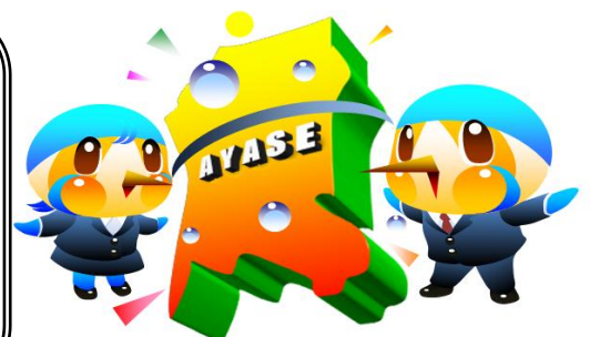
綾瀬市マスコットキャラクター あやびい