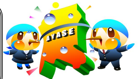
綾瀬市マスコットキャラクター あやびい