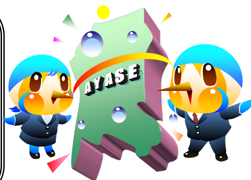
市のマスコットキャラクター あやびい