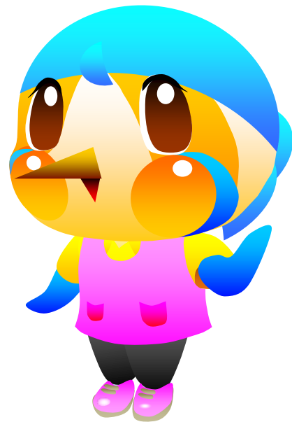
綾瀬市のマスコットキャラクター あやびい