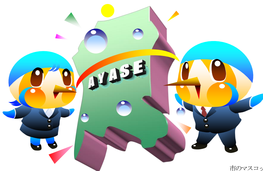
市のマスコットキャラクター あやびい