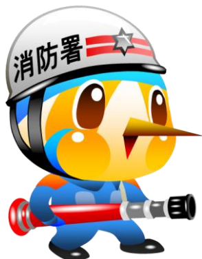
綾瀬市のマスコットキャラクター「あやびい」

「持続的な成長・発展を続けられるまち」であるために次のことを意識し、実践します。