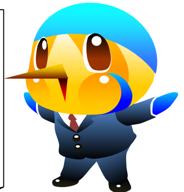
市のマスコットキャラクター あやびい