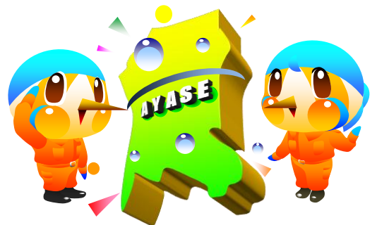
綾瀬市マスコットキャラクター あやびい