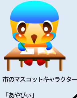
市のマスコットキャラクター

※新型コロナウイルス感染症の感染拡大防止のため、延期又は中止になる可能性があります。 情報は随時市ホームページに掲載します。