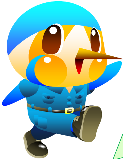
綾瀬市のマスコットキャラクター あやびい

綾瀬市では、求められる職員像「イニシャル“C”」を定め、人材育成に取り組み、綾瀬市の将来都市像「緑と文化が薫るふれあいのまち あやせ」の実現に向けて日々努めています。「イニシャル“C”」を、ともに取り組む 意欲・情熱のある人 が、綾瀬市の求める人材です。